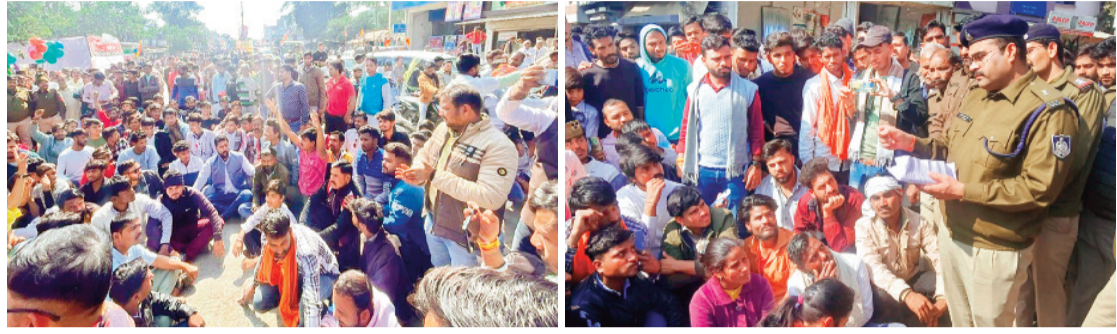
हरिभूमि न्यूज >>> ब्यावरा

टीआई की हठधर्मिता पर बिफरे लोग, हटाने को लेकर किया थाने का घेराव, एसपी का आश्वासन टीआई को करेंगे लाइन हाजिर