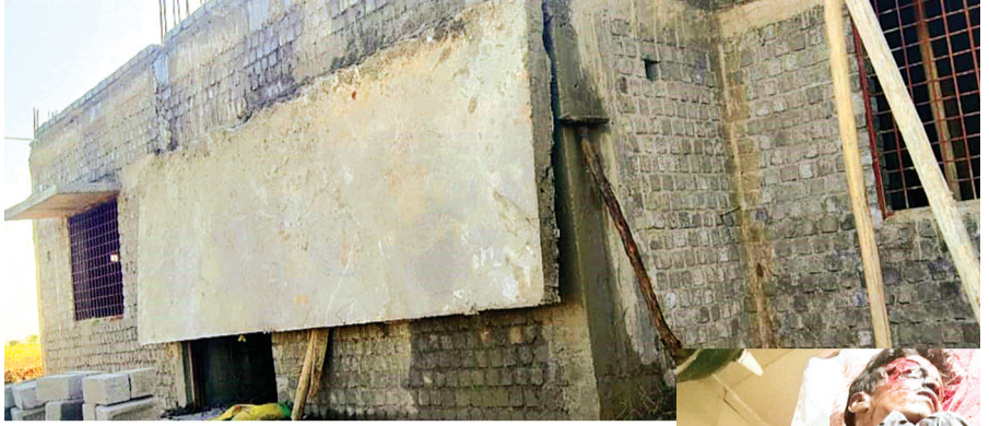
हरिभूमि न्यूज >>> कालापिपल

उप स्वास्थ्य केंद्र में बिल्डिंग का हो रहा था निर्माण